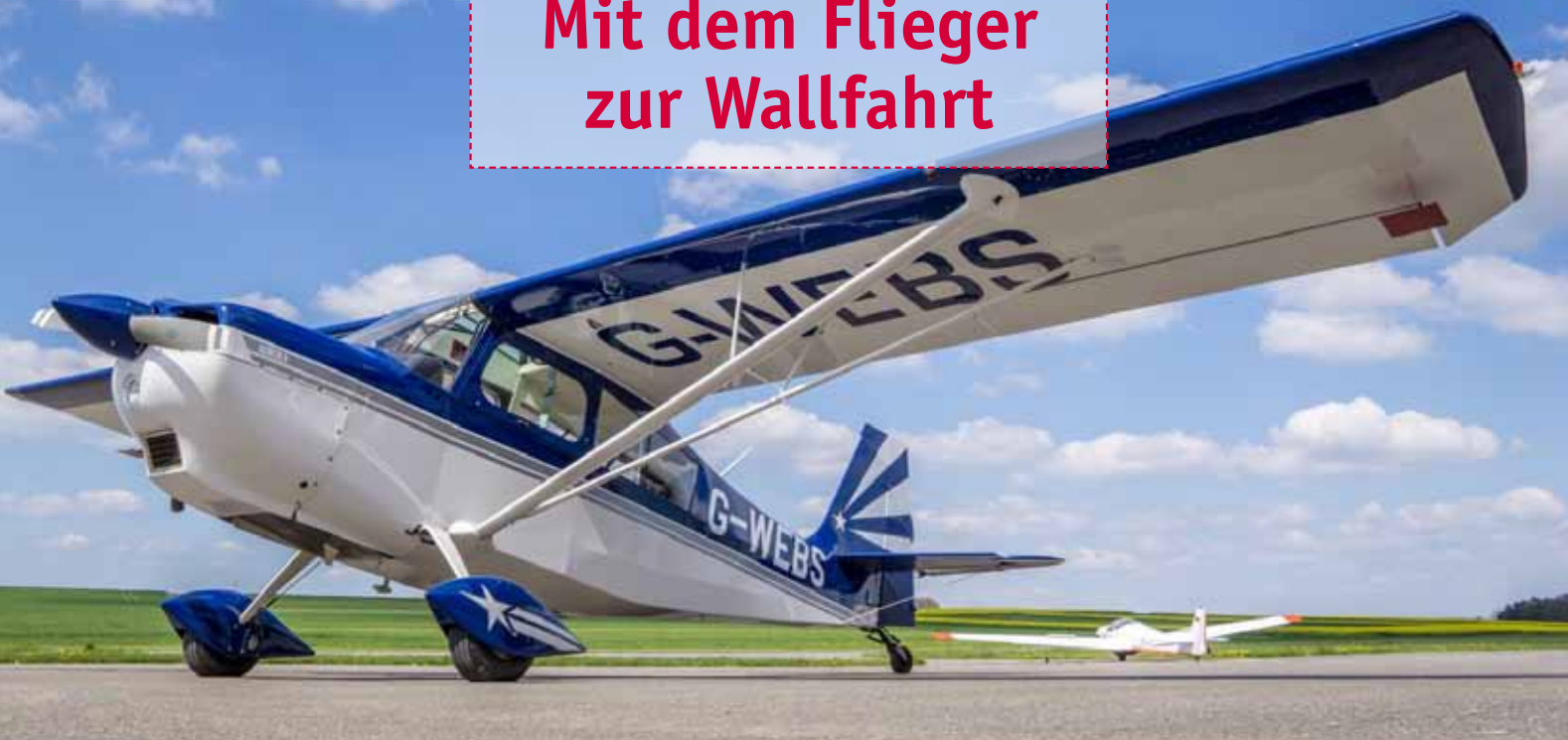
Die G-WEBS (oben) ist einer von acht Fliegern, die der Verein für seine Mitglieder bereitstellt. Anflug auf die 06: Das Maislabyrinth ist in direkter Nachbarschaft zum Flugplatz (rechts).

Das UNESCO-Weltkulturerbe Obergermanisch-Raetischer Limes navigiert den Piloten in die Stadt, die inmitten des Odenwaldes im Dreiländereck Baden-Württemberg, Hessen und Bayern liegt, nach Walldürn.